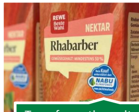
Transformation mit und in der Wirtschaft

Bundesgeschäftsstelle als Dienstleisterin für den Gesamtverband und NABU-Gliederungen (Inhalte, Projekte, Kommunikation, Organisation)