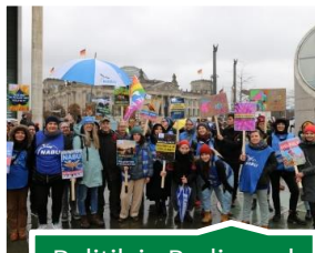
Politik in Berlin und Brüssel